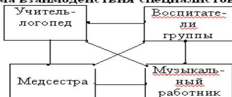
Схема взаимодействия специалистов ДОУ с узкими специалистами других организаций, с семьей.